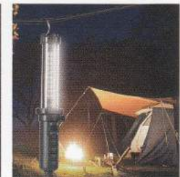
吊り下げフックを使用してレジャー照明に