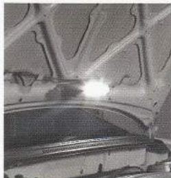
ボンネット内側に取り付けて車の整備などの作業用照明に