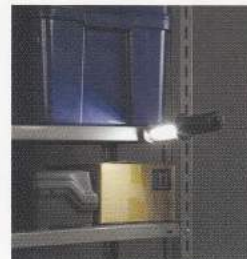
ガレージや倉庫などでの暗所照明に