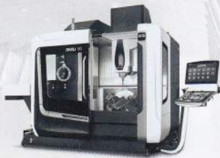
DMU 50 3 rd Generation