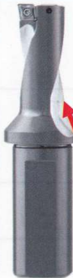
底刃フラット設定