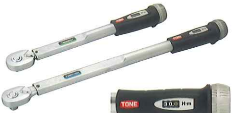
デジタル表示部分 (特許・意匠取得済)

ソケットホルド機構 ※着脱する場合、必ずプッシュボタンを押しながら行ってください。