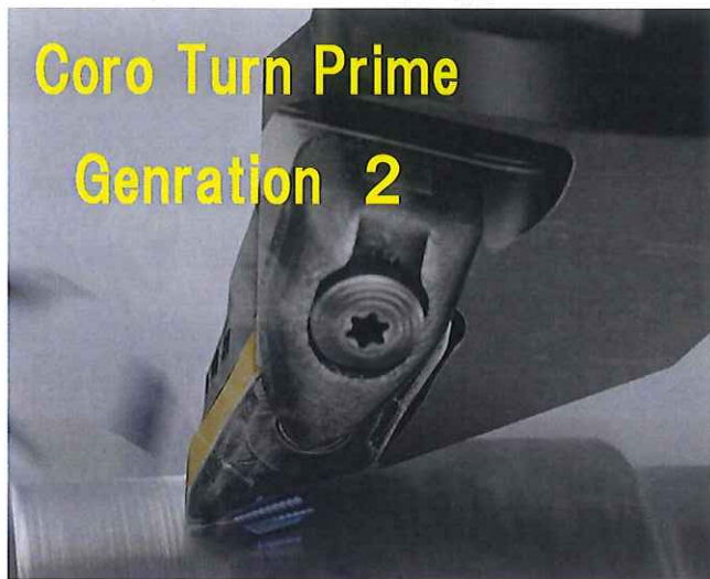
Coro Turn Prime Generation 2