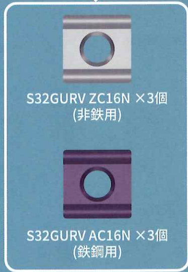
S32GURV ZC16N × 3個 (非鉄用)