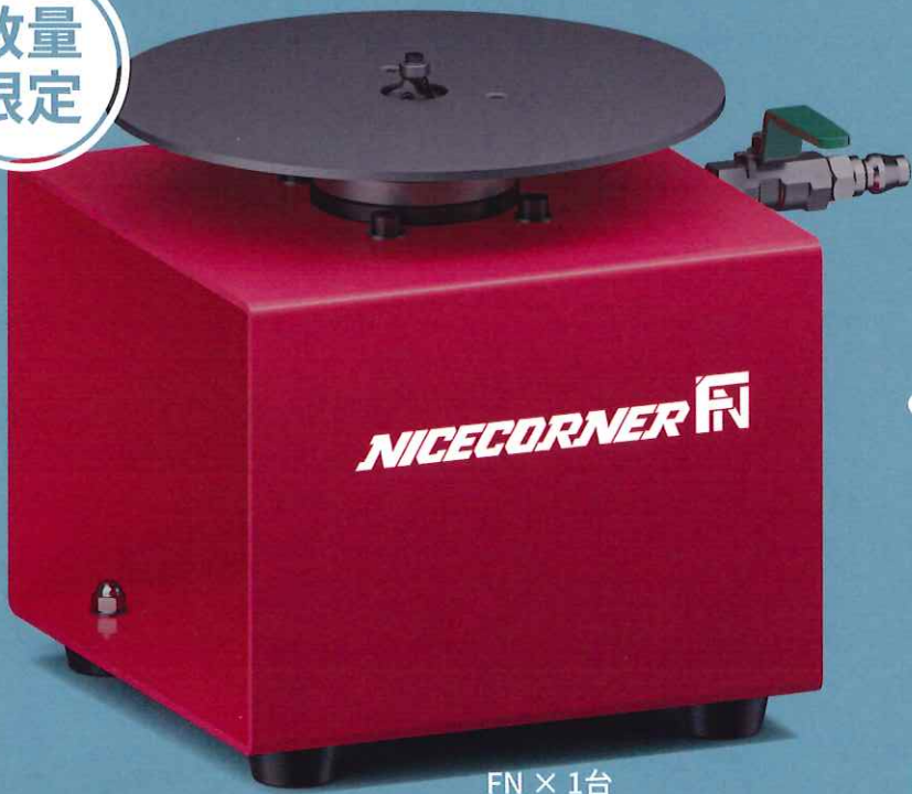
FN × 1台