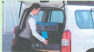
車の荷台にも簡単に積めます。