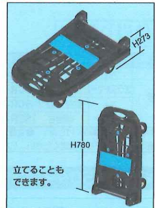
立てることもできます。